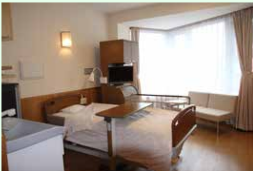
特別室 B (18.29㎡)