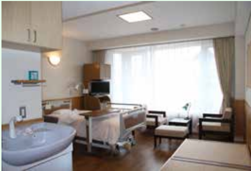
特別室 A 3タイプ (21.42㎡)