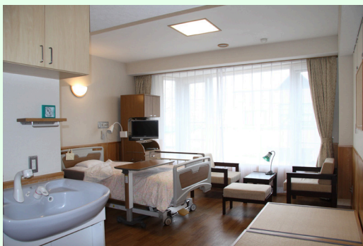
特別室 A (21.42㎡)