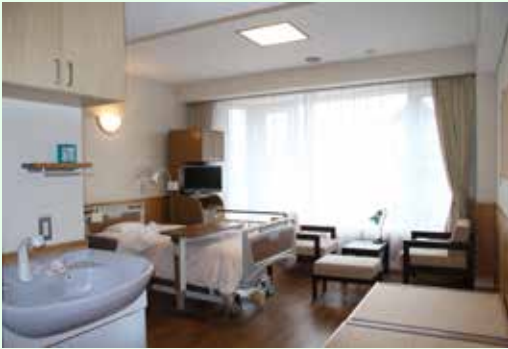
特別室 A (21.42㎡)