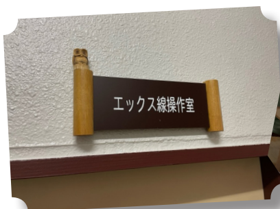
エックス線操作室