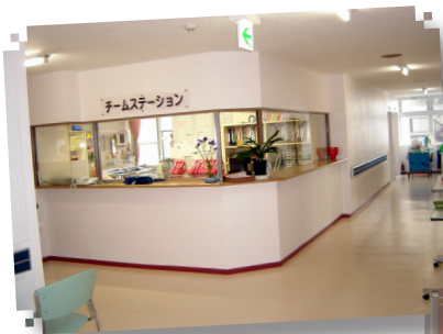
介護病棟チームステーション